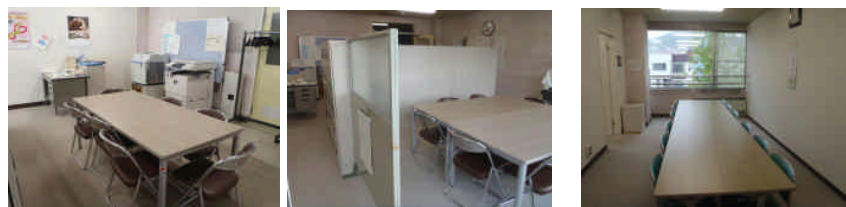
ボランティアルーム(開設 2004. 8. 3) 改装再開設 2011. 6. 1

小樽市社会福祉協議会 小樽市ボランティア・市民活動センター 〒047-0033 小樽市富岡1-5-10 小樽市社会福祉協議会内 TEL 33-5299 FAX 32-5641 Eメール ovcac@otaru-shakyo.jp URL http://otaru-shakyo.jp このセンター情報は共同募金の配分を受けて発行しております