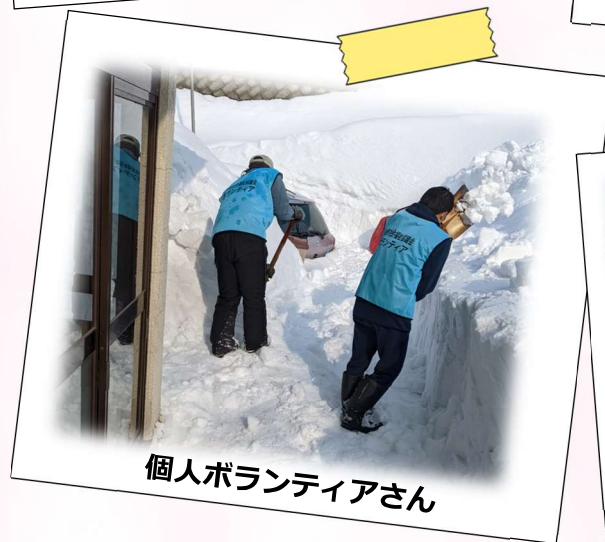
個人ボランティアさん