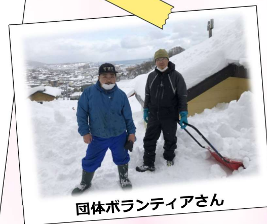
団体ボランティアさん