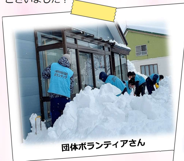
団体ボランティアさん