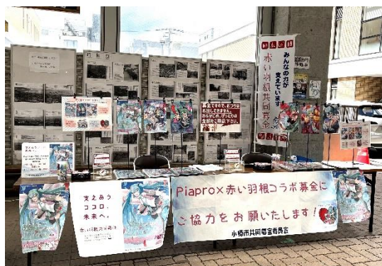
【小樽アニメパーティー 共同募金ブース】